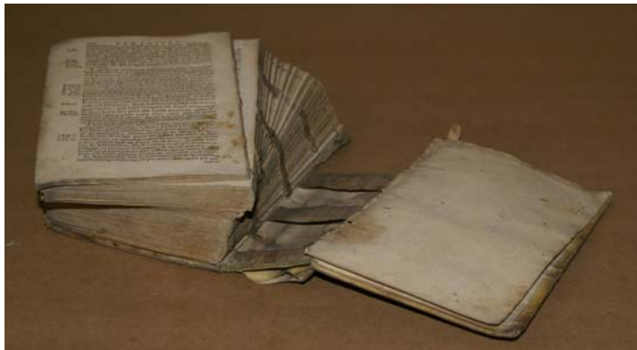
Fot. Przykład woluminu o zniszczonym szyciu, blok częściowo oddzielony od oprawy.

Część woluminów miała rozluźnione lub całkowicie zniszczone szycie – groziło to rozproszeniem kart i kwalifikuje te egzemplarze do jak najwcześniejszej pełnej konserwacji w specjalistycznej pracowni.