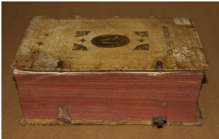
Fot. Starodruk w oprawie z desek oklejonych białą, garbowaną glinowo skórą – brak zapinek i urwane paski .

Większość ksiąg utraciła ważny element konstrukcyjny, zabezpieczający przed deformacją bloku, mianowicie zapinki bądź wiązania. Zapinki się połamały lub zagubiły, taśmy pourywały, na skutek czego okładki otwierały się i nie chroniły bloku.