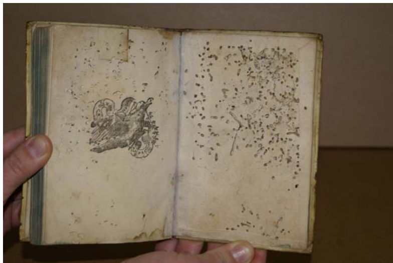
Fot. Jedna z książek najbardziej zniszczonych przez działanie owadów – korytarze przebiegają przez całą grubość bloku i przez okładki.

Częstym rodzajem zniszczenia były też zacieki. Był skutek zalania, zamoczenia i niekontrolowanego wysychania.