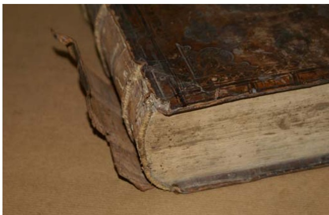
Fot. Często występujące zniszczenie oprawy – działanie wielu czynników powoduje odklejenie, a czasami całkowite oderwanie skóry na grzbiecie książki.

Oprawy były brudne, z uszkodzeniami mechanicznymi, ubytkami, zakwaszone, przesuszone, zniszczone przez owady. Wiele egzemplarzy miało oprawy oddzielone od bloku całkowicie lub częściowo.