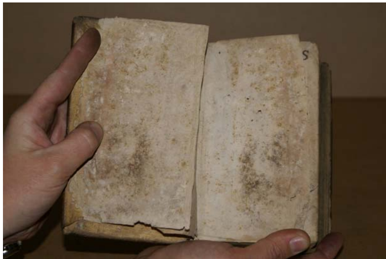
Fot. Plamy pozostawione przez intensywny wzrost grzybowy na kartach wyklejkowych książki

Inna grupa uszkodzeń spowodowana była procesem starzenia materiałów i szkodliwym działaniem czynników atmosferycznych. Na części woluminów widoczne były ślady działania mikroorganizmów i owadów (zniszczenia biologiczne). Rozwój drobnoustrojów widoczny był w postaci różnobarwnych zaplamień i przebarwień oraz osłabienia papieru. Przykładem ekstremalnego zniszczenia papieru pod wpływem działalności grzybów była tzw. puszysta destrukcja. Zniszczenia biologiczne koncentrowały się przy okładkach, w narożnikach, przy grzbiecie. Zdarzały się także egzemplarze w całości zaatakowane przez grzyby lub owady.