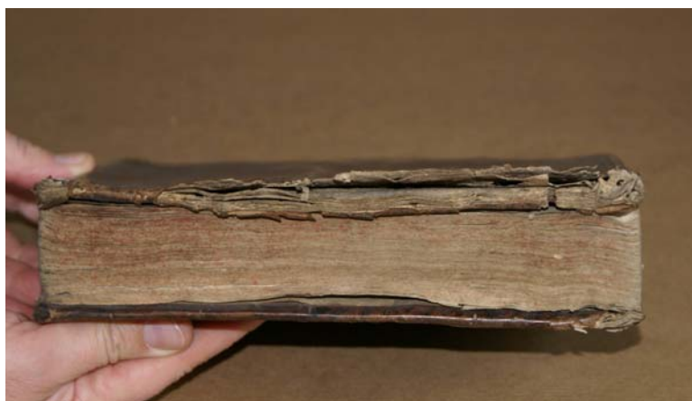
Fot. Przykład typowego zniszczenia opraw tekturowych – rozwarstwienia.