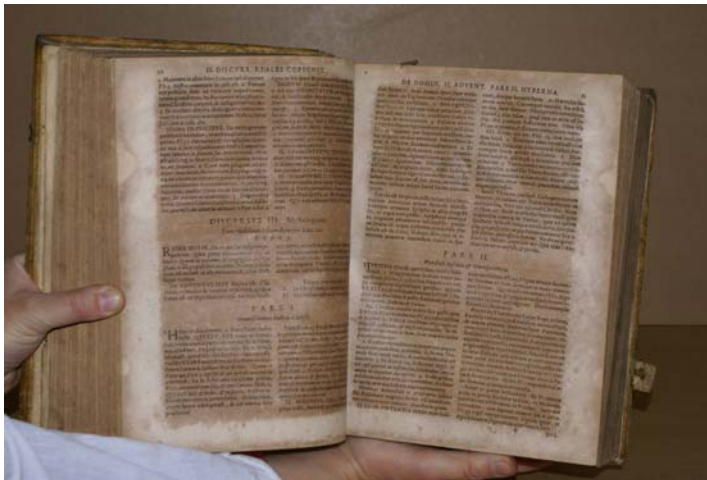
Fot. Zakwaszenie papieru

W jednej z książek intensywnie wystąpiły zniszczenia spowodowane przez atrament żelazowo-galusowy. Fragmenty najbardziej przesiąknięte atramentem uległy całkowitej destrukcji. Papier wyglądał jak spalony, był czarny, rozsywał się.